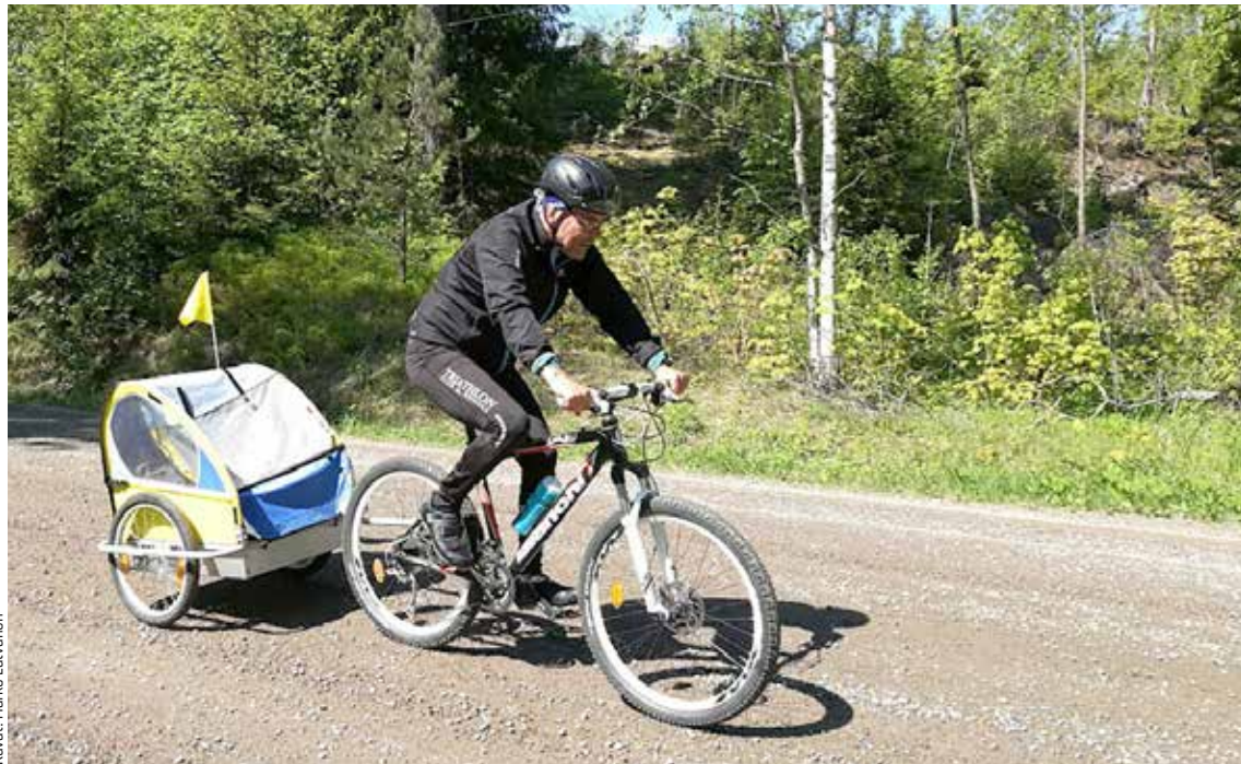
Kärryllä kulkee mainio matkaseura, tai retkivarusteet, helposti.

Heinolan postilaatikkopyöräily-kampanja on koko kesän mittainen kampanja, jossa tarkoituksena on käydä tekemässä oma pyöräretki yhdelle useista Heinolan ympärille asennetuista postilaatikoista. Laatikot ovat punaisia ja niistä löytyy kampanjan tarra. Postilaatikosta löytyvään vihkoon voi kirjoittaa nimensä ja puhelinnumeron, jolla