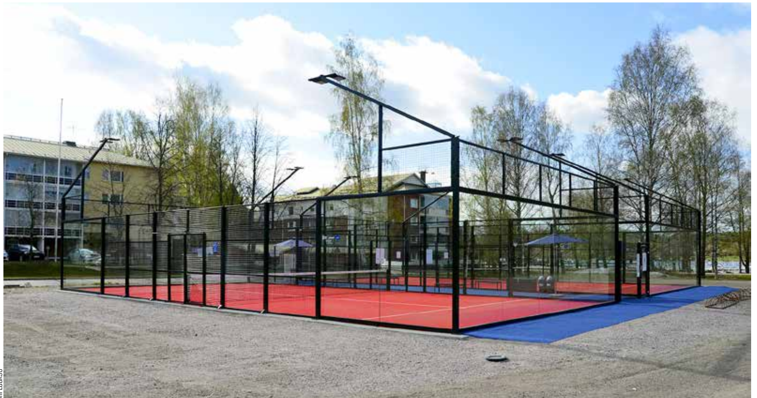
Heinolassa padelkenttä on hienossa paikassa lähellä Kylpylän rantaa.

Liigan kilpailuareenana toimivaa padelkenttää upeissa vesistömaissa pyörittävä Piers Boden kertoo, että kentän ensimmäinen lähes kokonainen vuosi on sujunut