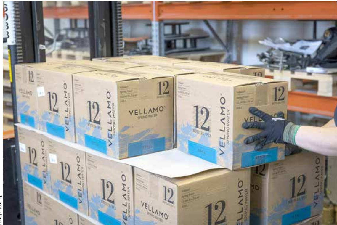
Ice Age Water Oy

Vellamo-mineraalivesi on lähtöisin Heinolan Viikinäisissä sijaitsevasta, Suomen ainoasta luonnon