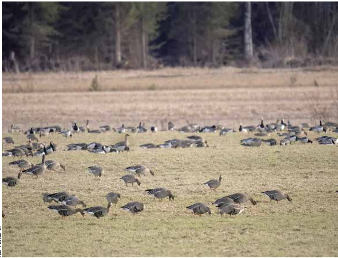
Lintuharrastaja näkee tässä kuvassa metsähanhia, tundrahamia ja valkoposkihanhia. Peltoa viljelevä maanviljelijä puolestaan näkee kuvassa ison ongelman.

PELLON REUNALLA tilannetta tarkkaileva viljelijä ei vieroksu tilannetta siksi, että pellolla on hanhia. Hän muistaa tilanteen kymmenen