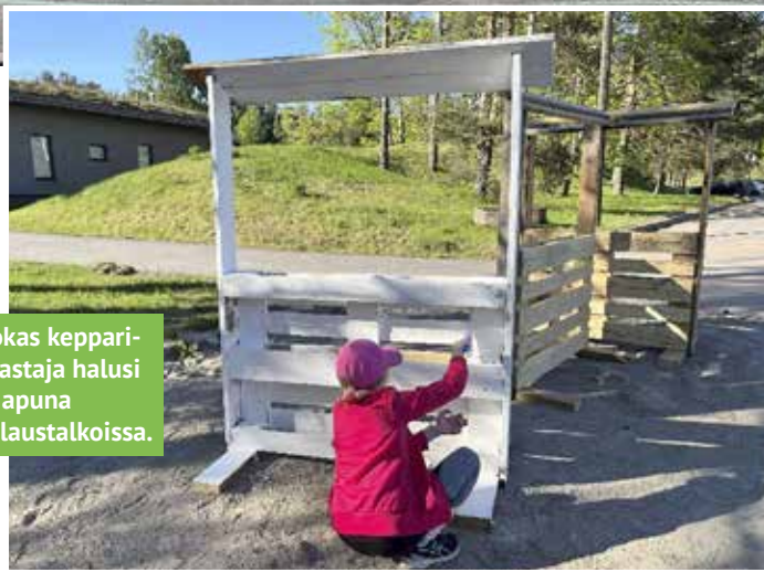
Innokas keppariharrastaja halusi olla apuna maalaustalkoissa.