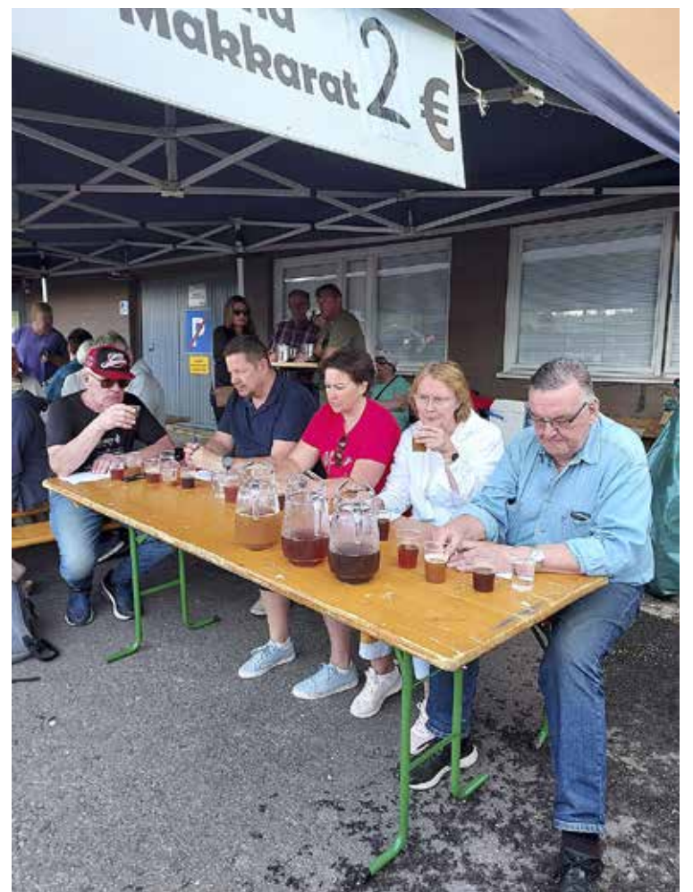
Sahtiraatilaiset haastavassa työssään.