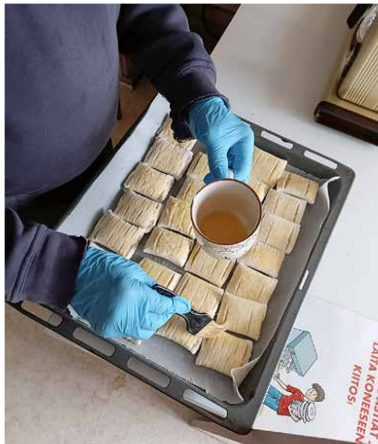
Jyränköläkodin aamu- ja iltapalat tehdään ohjaajien kanssa yhdessä.

– Osa on meillä muutaman viikon, osa jopa vuosia, kuntoutusoh-