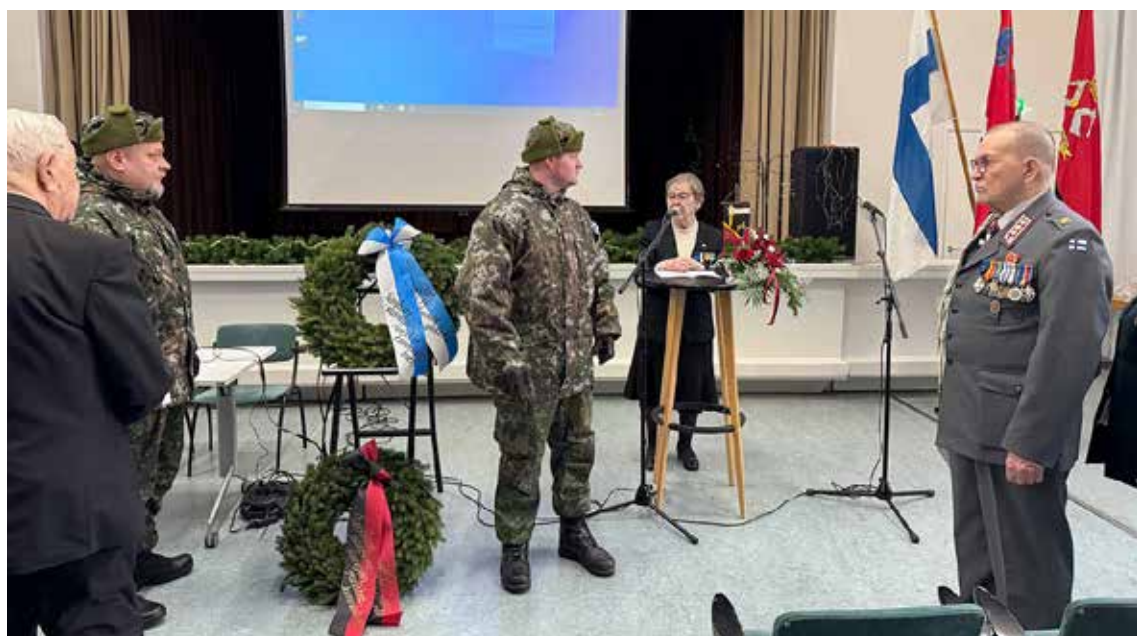
Seppelpartio lähetettiin Heinolan sankarivainajien ja Karjalaan jääneiden muistomerkeille.