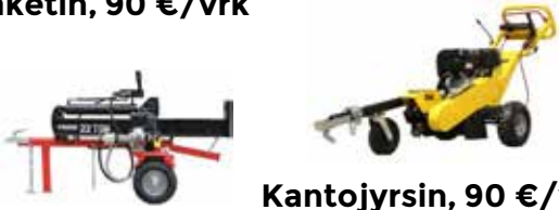
Kantojyrsin, 90 €/vrk